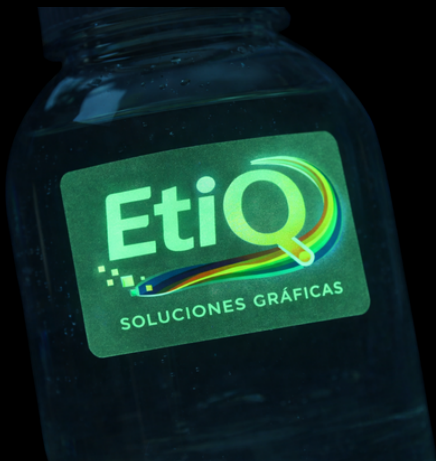
GLOW IN THE DARK