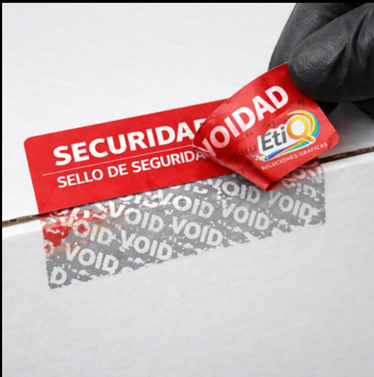
ETIQUETAS DE SEGURIDAD

En EtiQ podemos ofrecer etiquetas para todos los usos incluyendo: